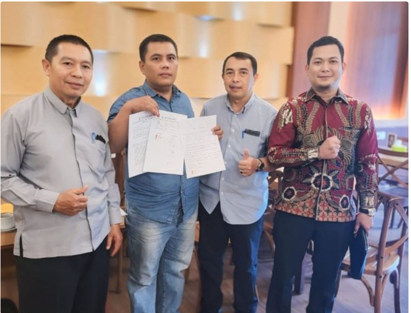
Kuasa Hukum Ningto Wahyu Dens & Partners Lawfirm di perkara Dugaan Pemalsuan Data dan Kredit Fiktif di Bank BRI Unit Kalideres.

JAKARTA, JNI - Seorang bekas nasabah Bank BRI, yang dikenal dengan inisial NW, melaporkan dugaan pemalsuan data dan kredit fiktif yang melibatkan oknum pegawai Bank BRI Unit Kalideres.